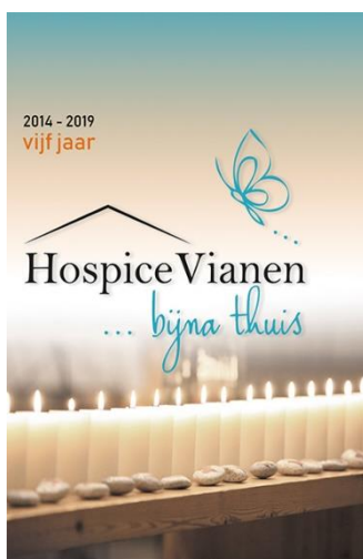
Voorkant Jubileum uitgave

Door vrijwilligers en nabestaanden en familie van onze gasten is er in een gezamenlijke inspanning een herdenking boekje geschreven. Op 9 februari ,officiële startdatum van de eerste gast in 2014, is het eerste boekje overhandigd aan de leden van het comité van aanbeveling.